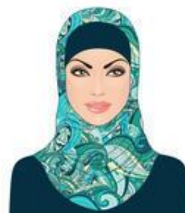
Ghazal z Iranu

W 2014 roku pewnego ciepłego dnia zwrócił się do mnie z prośbą polski podróżnik, żebym się z nim spotkała i opowiedziała mu o Shiraz, dawnej stolicy Persji. 28 sierpnia 2014 roku wzięliśmy ślub. We wrześniu wsiadłam do samolotu i przyleciałam do Polski z moim mężem.