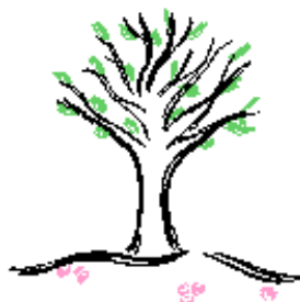
kwitnąć (drzewa kwitną)