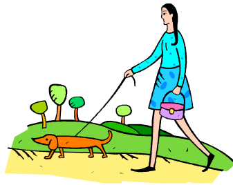
spacerować z psem w parku