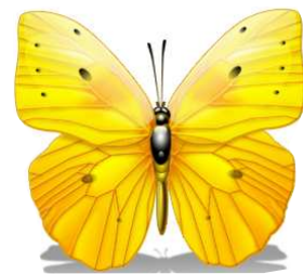
motyl (motyle latają)