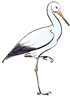
bocian (bocian klekocze)