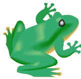
żaba (żaba kumka)