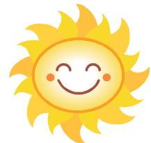
słońce (świeci słońce)