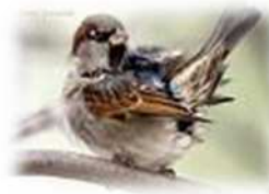
wróbel (wróbel ćwierka)