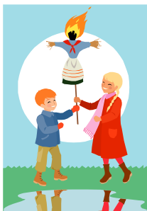
marzanna (topić marzannę)