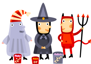
CUKIEREK ALBO PSIKUS