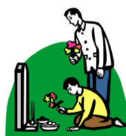
SKŁADAĆ KWIATY ZAPALAĆ ZNICZE MODLIĆ SIĘ