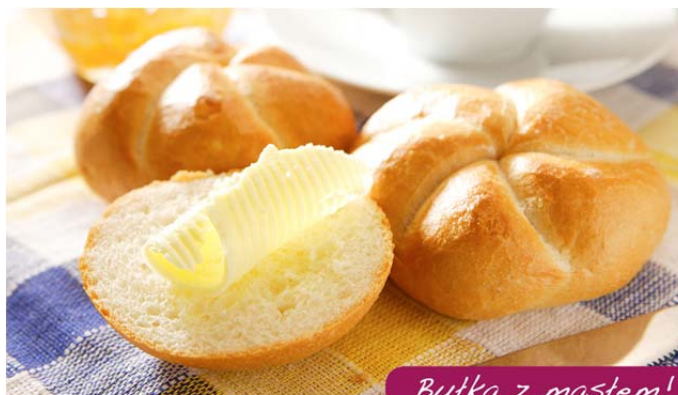
Bułka z masłem!

2. Szachy to nie bułka z masłem. Trzeba dużo myśleć i mieć dobrą strategię.