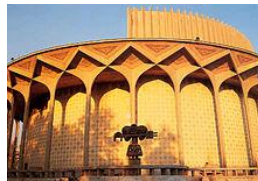
Teatr w Teheranie