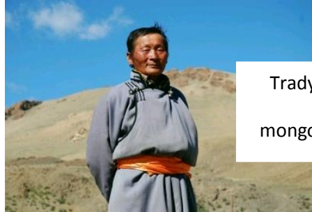
Tradycyjny strój mongolski to deel.