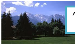
Alpy w Bawarii

– państwo w Europie Zachodniej będące od 1990 roku federacją 16 landów. Kraj rozciąga się między morzami: Bałtyckim oraz Północnym i Alpami (od południa). Niemcy są różnorodne zarówno geograficznie, jak i pod względem kulturowym i językowym. Każdy z landów ma własną administrację i konstytucję, swoiste tradycje i zwyczaje. Język niemiecki, który jest drugim najbardziej rozpowszechnionym językiem w Europie (za pierwszy uznaje się angielski), dzieli się na wiele dialektów i gwar używanych w różnych częściach kraju.