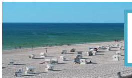
Plaża na wyspie Sylt

stolica: Berlin waluta: euro język urzędowy: niemiecki dominujące religie: katolicyzm, protestantyzm, islam, judaizm