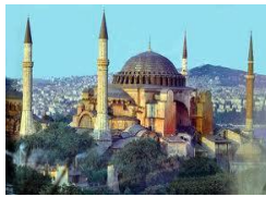
Hagia Sophia – Sztambuł