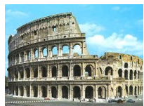
Koloseum – Rzym