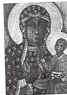
Matka Boska Częstochowska

Główne święto Matki Boskiej Częstochowskiej, czyli tzw. Czarnej Madonny . Jest to kulminacyjny dzień pielgrzymek do sanktuarium maryjnego na Jasnej Górze przed cudowny obraz.