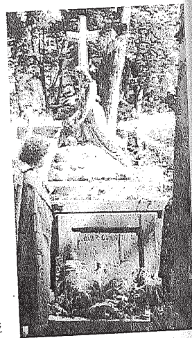
Cmentarz Łyczakowski we Lwowie, grób Artura Grottgera

W Polsce bardzo uroczysty dzień, wolny od pracy. W potocznej świadomości, zgodnie z powstałą tradycją, jest obchodzony jako wspomnienie zmarłych, czyli Dzień Zaduszny (Zaduszki), który przypada faktycznie na 2 listopada. Pierwszego listopada Polacy przychodzą na groby (mogiły) swoich bliskich, zapalają świece i znicze, przynoszą wieńce i kwiaty, najczęściej chryzantemy. Zanika już zwyczaj chowania zmarłych w grobach ziemnych. Nie ma jednak również pomników-obelisków, niekiedy arcydzieł funeralnej sztuki rzeźbiarskiej. Polskie cmentarze dla kilku osób (rodziny), betonowe grobowce wyłożone na powierzchni granitem, często ze standardową, pionową „płytą” z wyrzeźbionymi na niej napisami. Zachowuje się zwyczaj mszy za zmarłych, a w czasie Wszystkich Świętych zamawiania tzw. wypominek i mszy oktawalnych (zmarłego wspomina się przez osiem dni). Najbardziej znane, stare i szacowane polskie nekropole to: Powązki w Warszawie i cmentarz Rakowicki w Krakowie oraz cmentarze w Wilnie na Litwie (na Rosję) i we Lwowie na Ukrainie (cmentarz Łyczakowski). Motyw grobu (mogiły) jest popularny w polskiej literaturze. Pojawia się np. w powieści Elizy Orzeszkowej Nad Niemnem .