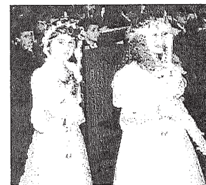
Pierwsza Komunia Święta