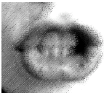
Układ warg podczas wymawiania głoski cz