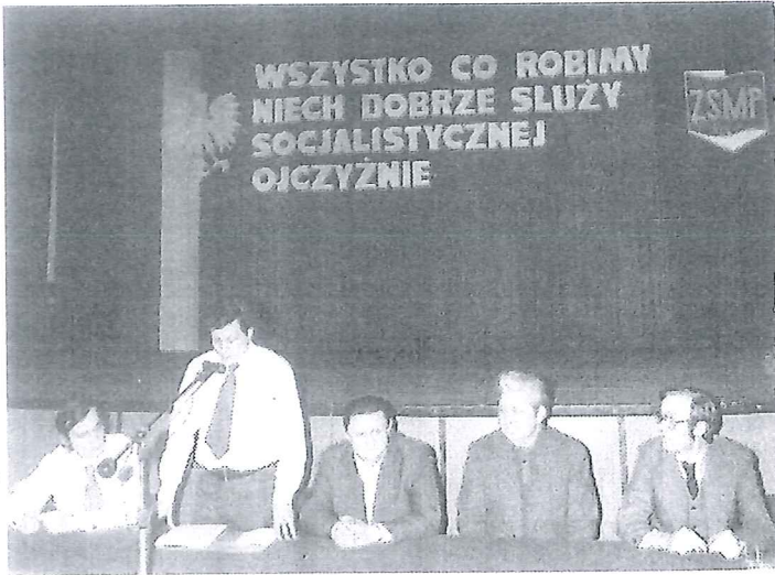
Zjazd organizacji młodzieżowej

czać lub wykorzystywać. Agresywność i kult siły charakterystyczne dla gitowców, podział świata na swoich i obcych pojawiły się później w subkulturach kibiców piłkarskich i skinheadów.