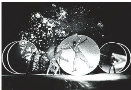
Dante na kanwie Boskiej komedii , reżyseria i scenografia Józef Szajna, Teatr Studio, Warszawa 1974

Boska komedia , Raj, pieśń XXXIII, w. 133–138